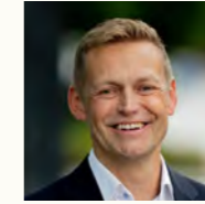
Inge Reinertsen Konsernsjef, SpareBank 1 Sør-Norge