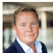
Are Gråthen Regionsdirektør, Samskip